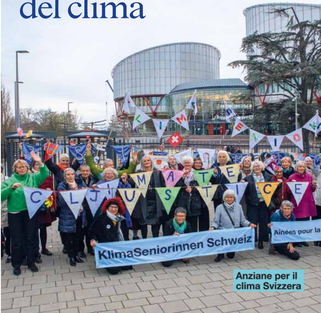
Anziane per il clima Svizzera